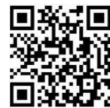
動画視聴用 申込フォーム

申込先メールアドレス： chuou-kou@city.takasaki.gunma.jp