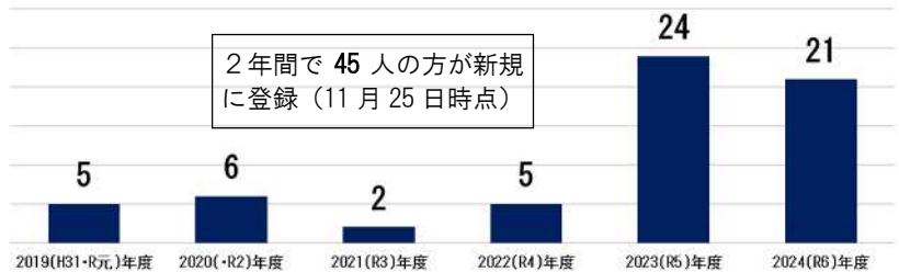
《年度別一般(大人)の貸出利用者数》

2018 (H30)年度 2019 (H31-R元)年度 2020 (R2)年度 2021 (R3)年度 2022 (R4)年度 2023 (R5)年度 2024 (R6)年度