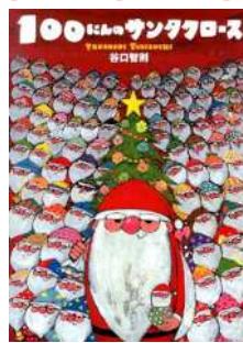
谷口 智則 『100にんの サンタクロース』 (文溪堂)