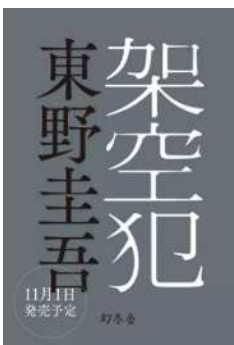
東野 圭吾 『架空犯』 (幻冬舎)