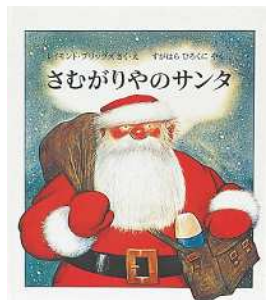
レイモンド・ブリッグズ 作・絵 すかはらひろくに 訳 『さむがりやのサンタ』 (福音館書店)