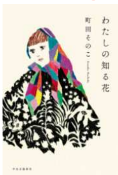
町田 そのこ 『わたしの知る花』 (中央公論新社)