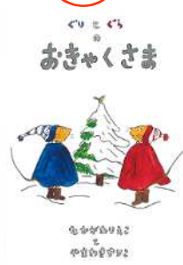
なかがわりえこ 作 やまわきゆりこ 絵 『ぐりとぐらのおきゃくさま』 (福音館書店)