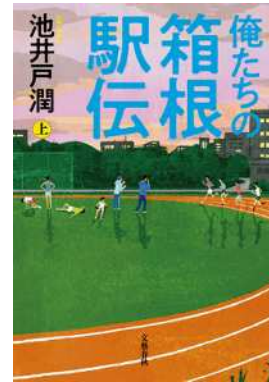
池井戸 潤 『俺たちの箱根駅伝 上・下』 (文藝春秋)