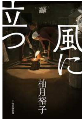
柚月 裕子 『風に立つ』 (中央公論新社)