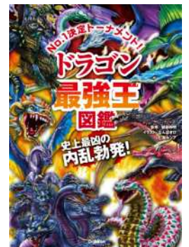
健部 伸明：監修 なんばきび 七海ルシア：絵 『ドラゴン最強王図鑑』 (Gakken)