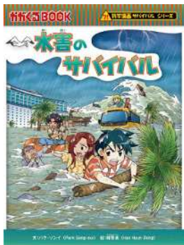
パク・ソニイ：文/韓賢東：絵 『水害のサバイバル』 (朝日新聞出版)