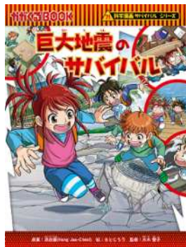
洪在徹：原案 もとじろう：絵/大木聖子：監修 『巨大地震のサバイバル』 (朝日新聞出版)