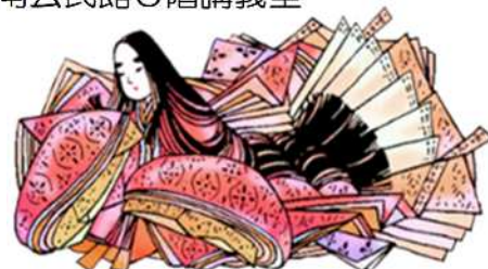
今回は「末摘花の巻」から